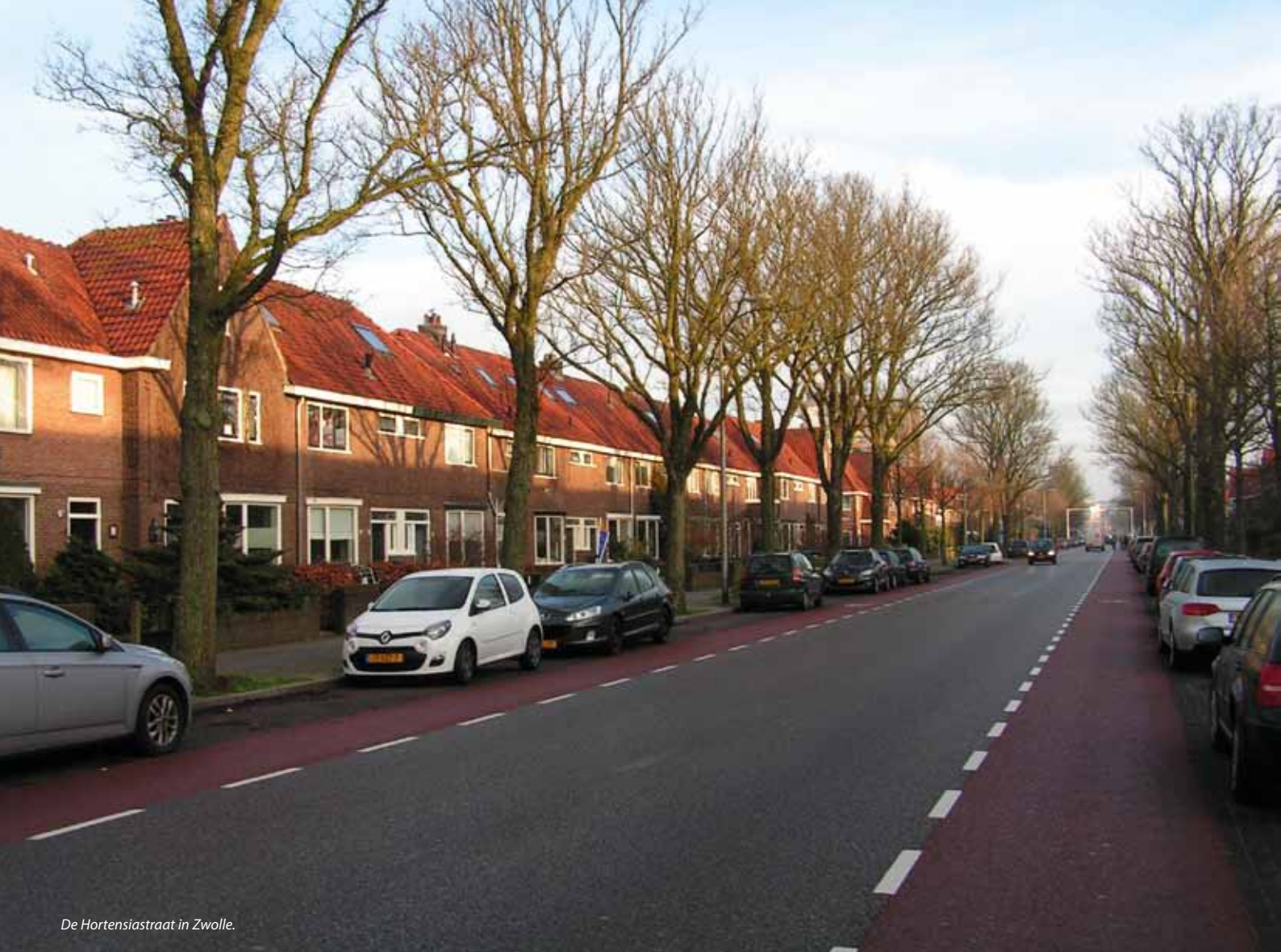
De Hortensiastraat in Zwolle.