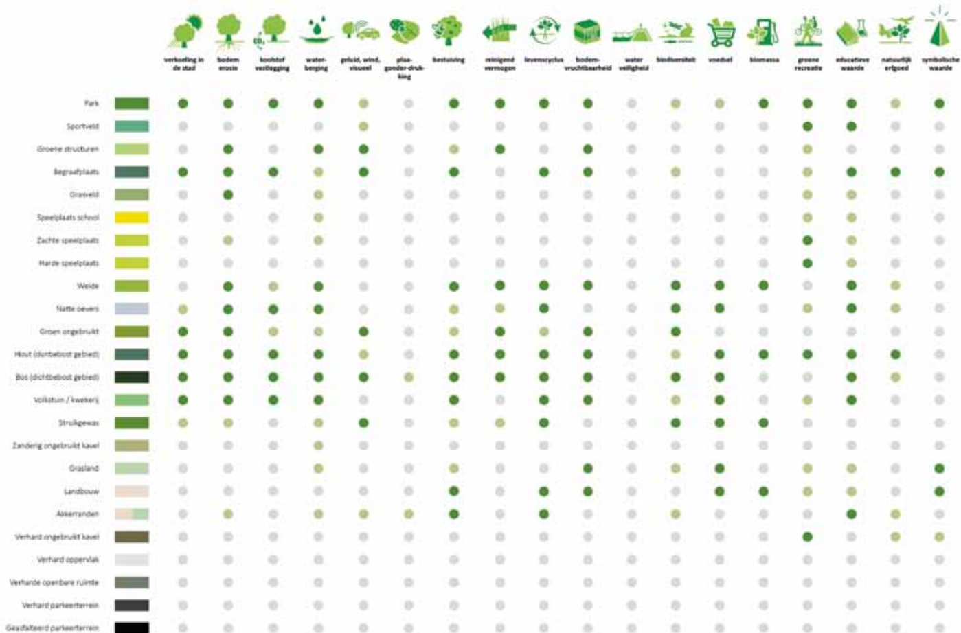
Aan de hand van de Atlas Natuurlijk Kapitaal werd in kaart gebracht welke ecosysteemdiensten Zwolse 'soorten' groen leveren.

Het derde scenario richt zich op groen ten zuidoosten van de stad. Hier kan een grote waterplas worden aangelegd, inclusief ruige oevers, met een waterbufferende en recreatieve functie. Dit ontwerp kenmerkt zich naast de waterplas door de aanleg van bioswales in straten (vergelijkbaar met wadi's), sportvelden met wilde randen, groenblauwe daken en wegen met wadi's. Voor elk model werden vervolgens de baten in kaart gebracht. Hoewel de Urbanisten een slag om