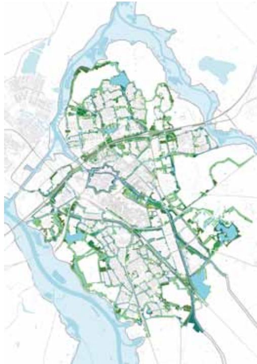
Model Singelstad Zwolle